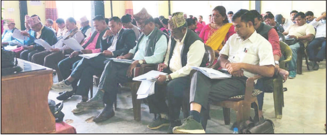
भूमिकास्थान नगरपालिकाको नगरसभाको १७औं अधिवेशनमा नगरसभा सदस्यको रुपमा सहभागि वडा अध्यक्ष, नगर कार्यपालिका सदस्य तथा वडा सदस्य ज्यूहरु